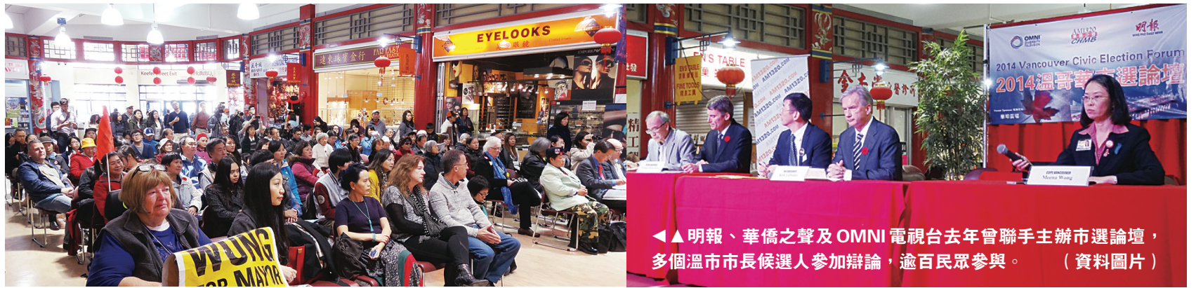
◀▲ 明報、華僑之聲及 OMNI 電視台去年曾聯手主辦市選論壇，多個溫市市長候選人參加辯論，逾百民眾參與。(資料圖片)

【明報專訊】明報、華僑之聲及 OMNI 電視台將於今明兩天舉辦兩場大選論壇，四個聯邦政黨，包括保守黨、新民主黨、自由黨及綠黨將會派出候選人，參加辯論及回答提問。