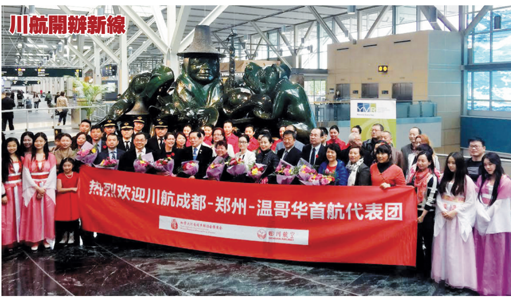
溫哥華國際機場 (YVR) 本月 11 日迎來首個從中國鄭州新鄭國際機場 (CGO) 起飛的 3U8501 航班, 這個由四川航空開辦的航線每周兩班, 抵達及離開溫哥華國際機場的時間分別是上午 8 時 35 分和上午 10 時 25 分。聯邦參議員胡子修及列治文市長區澤光等參加首航的歡迎儀式。